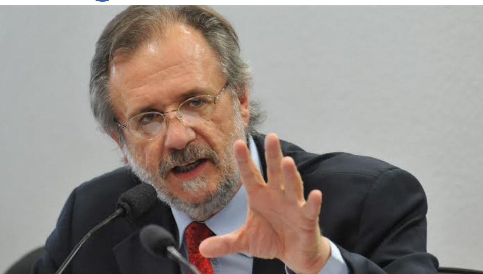
A Lei do Artesão também contou com a assinatura do ministro do Trabalho e Previdência Social, Miguel Rossetto, que ressaltou a importância para a economia e a cultura do país.

Um projeto de lei que tramitava há cinco anos entre o Senado Federal e a Câmara dos Deputados finalmente virou lei e ficará marcado na história dos artesãos de todo o Brasil. No dia 23 de outubro, a presidenta da República, Dilma Rousseff, sancionou, sem vetos, a Lei nº 13.180, responsável por regulamentar a profissão de artesão. A partir desta medida, cerca de 10 milhões de brasileiros terão a profissão regulamentada e garantidos inúmeros benefícios.