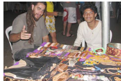
Artesanato, comidas típicas, música, arte e cultura são as atrações da Expo Mult Gama.