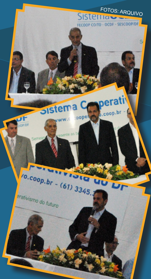
Manifestações no lançamento da escola de Cooperativismo no DF

Os diretores financeiro e sindical também são pessoas renoma-