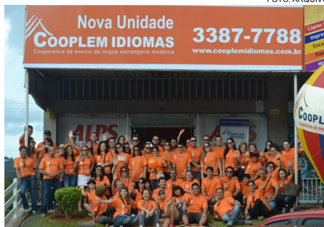
A Cooplem trabalha para o crescimento pessoal e profissional.

Para auxiliar ainda mais o desenvolvimento dos professores, a Cooperativa incluiu no plano de ação uma ajuda de custo para cursos no exterior, com o intuito de proporcionar a esses profissionais a vivência da língua e da cultura estrangeira. Essas oportunidades podem ser conquistadas por meio de acúmulo de pontuação de cada professor, sendo que os pontos seguem determinados critérios, como tempo na cooperativa e número de turmas. A